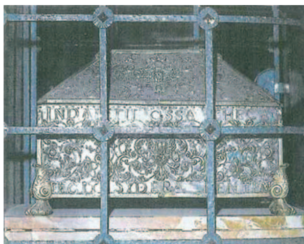
Urna de los restos de San Indalecio que se conserva en el altar mayor de la Catedral de Jaca.