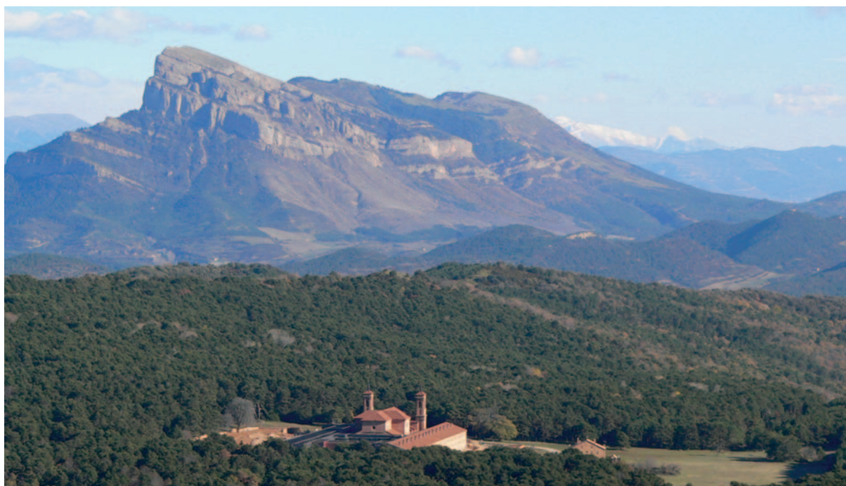
El Monte Pano (c. 1200 m), con el Monasterio Nuevo, la pradera y sus pinares. Al fondo, acantilados y solanas de Oroel, tan diferentes de la umbría por el efecto de los incendios.

El legislador define un Monumento Natural como aquel “Espacio constituido por elementos de la gea y de la flora o por formaciones geológicas y yacimientos paleontológicos de notoria singularidad, rareza o belleza” y estipula que su declaración debe hacerse por Decreto del