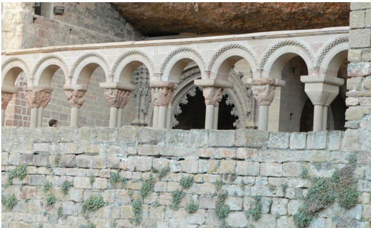
Muros del Monasterio Viejo de San Juan, con Petrocoptis hispanica (Willk.) Pau, descubierto allí mismo en junio de 1850.

Gobierno de Aragón. Aparte del monasterio “más importante de la Alta Edad Media y primer panteón real de Aragón”, se mencionaban para nuestro espacio los siguientes elementos de interés: