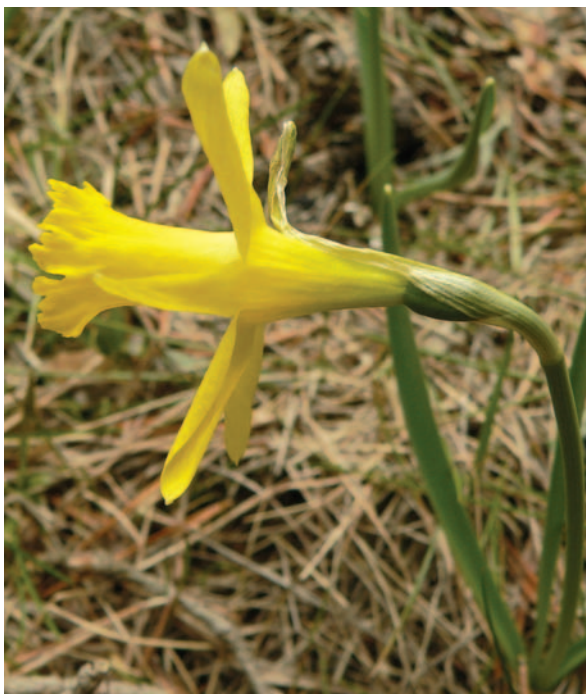
Narcissus jacetanus Fern. Casas, frecuente en la pradera de San Juan a fines de invierno o en primavera.

Desde el punto de vista geológico, las Sierras Prepirenaicas de San Juan y Oroel están formadas por conglomerados con cemento calizo, de origen marino –de ahí sus abundantes fósiles–, margas grises, areniscas del flysch, etc. Se trata de suelos básicos pero en algunos puntos se hallan acidificados (lavados) en superficie. El clima presenta notables contrastes entre las umbrías relativamente húmedas, las cejas con nubes parásitas, los cresteríos batidos por el viento y las solanas bastante más secas.