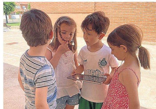
Alumnos del CRA, en plena yincana.

HUESCA. Alumnado y profesorado de inglés del CRA Montearagón realizaron en mayo grabaciones personalizadas de cuentos en inglés. Editaron sus vídeos y los transformaron en códigos QR que después se pegaron en diferentes sitios de las localidades del CRA. Junto a su familia buscaron, descubrieron y visionaron las producciones de sus compañeros de otra localidad pero del mismo colegio. ● CRA MONTEARAGÓN