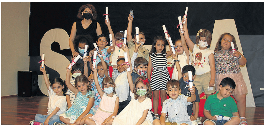
Los pequeños levantando sus diplomas tras acabar Infantil.

Entre aplausos, alegría, sorpresas, un coctel de grandes emociones nos han entregado un diploma con una frase muy bonita que dice: El Colegio Santa Ana de Huesca concede el diploma a... por concluir con éxito el ciclo de Educación Infantil, por aportar tu granito de arena cada curso con ilusión, tu cariño, tu forma de ser,