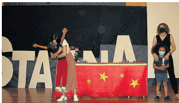
Dos pequeños reciben el cariño de las profesoras.

por superar limitaciones y convertirlos en logros y por disfrutar, aprender, reír, jugar, compartir y ser feliz. En ellos aparecían cada uno de nuestros nombres. De parte de todas las profes de Infantil: ¡gracias chicos!, No nos olvidaremos nunca de vosotros y siempre estaréis en nuestro corazón. ● COLEGIO SANTA ANA. HUESCA